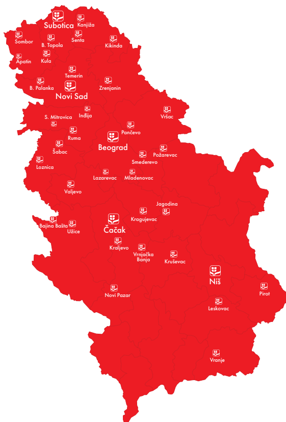
Grafikon 2. Društvo u Srbiji

Društvo je u 2021. godini imalo izmenjenu strukturu portfelja neživotnih osiguranja u odnosu na 2020. godinu (smanjeno je učešće obaveznog osiguranja autoodgovornosti, a povećane su druge vrste imovinskih osiguranja). Takođe, nizom mera se vršilo otklanjanje osiguranih rizika sa najvećom stopom šteta kao i smanjenje broja rizičnih prihвата u osiguranje.